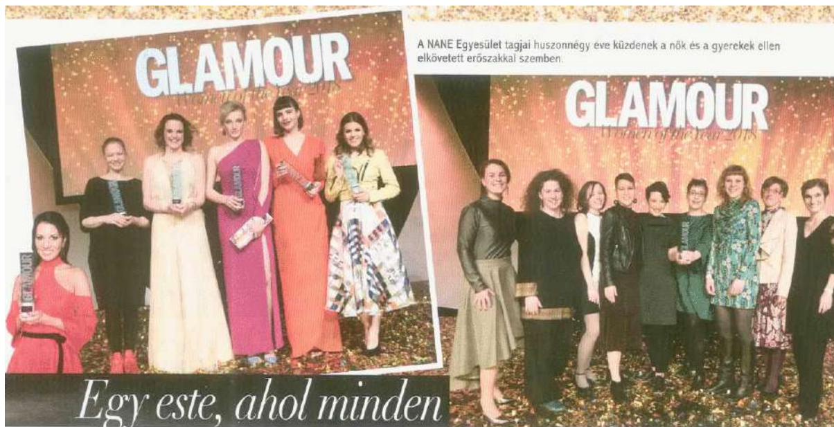
A NANE Egyesület tagjai huszonnégyszer küzdöttek a nők és a gyerekek ellen elkövetett erőszakkal szemben.